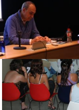
Comerç Just al Club Muntanyenc