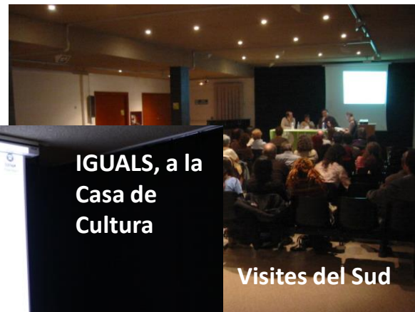
IGUALS, a la Casa de Cultura